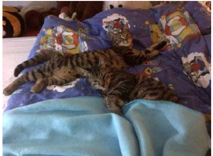
02.01.2013 Romme` und Mau-Mau

Sie wiegen jetzt schon über 3kg und haben sich prächtig entwickelt. Wenn es ein paar tolle Action Fotos der beiden gibt, schreibe ich Ihnen gerne. Sie können durchaus auch wild sein, nur hat man da keinen Fotoapparat zur Hand... Über eine Mail von Ihnen, was sich im Tierheim so verändert, freue ich mich. Im Illertisser Extra und Anzeiger verfolge ich die aktuellen Findel-Tiere und hoffe das Sie für alle einen guten Platz finden. Wir sind total glücklich mit den beiden und noch mal großes Lob an die Leistungen im Tierheim. Wir hatten mit den beiden keine Probleme in der Eingewöhnungszeit und sie waren von Anfang an sauber. (bis auf Katermarkieren, aber das war nur für kurze Zeit).